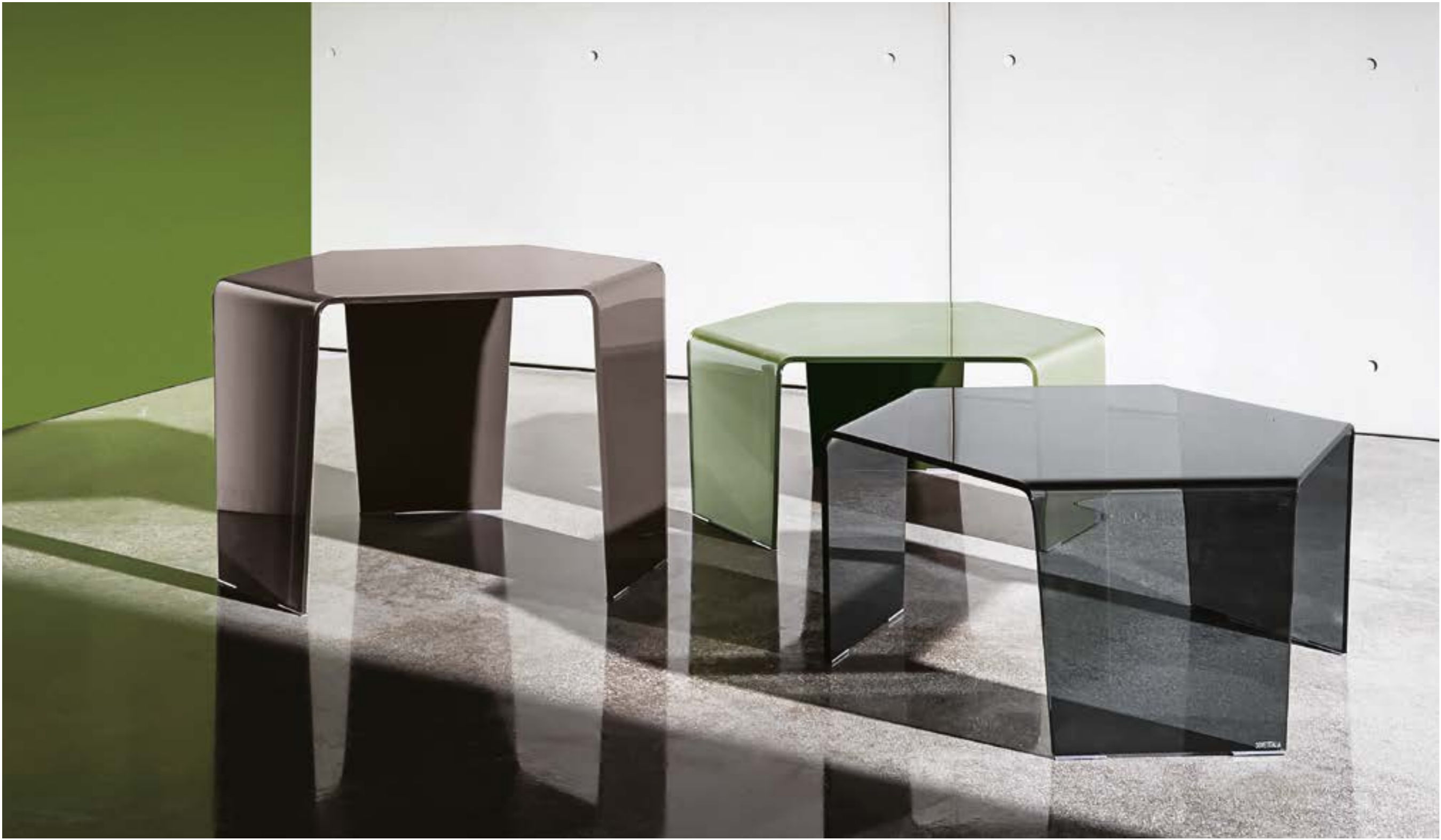
3 Feet coffee tables TEC1 / TEV2 / TTF.