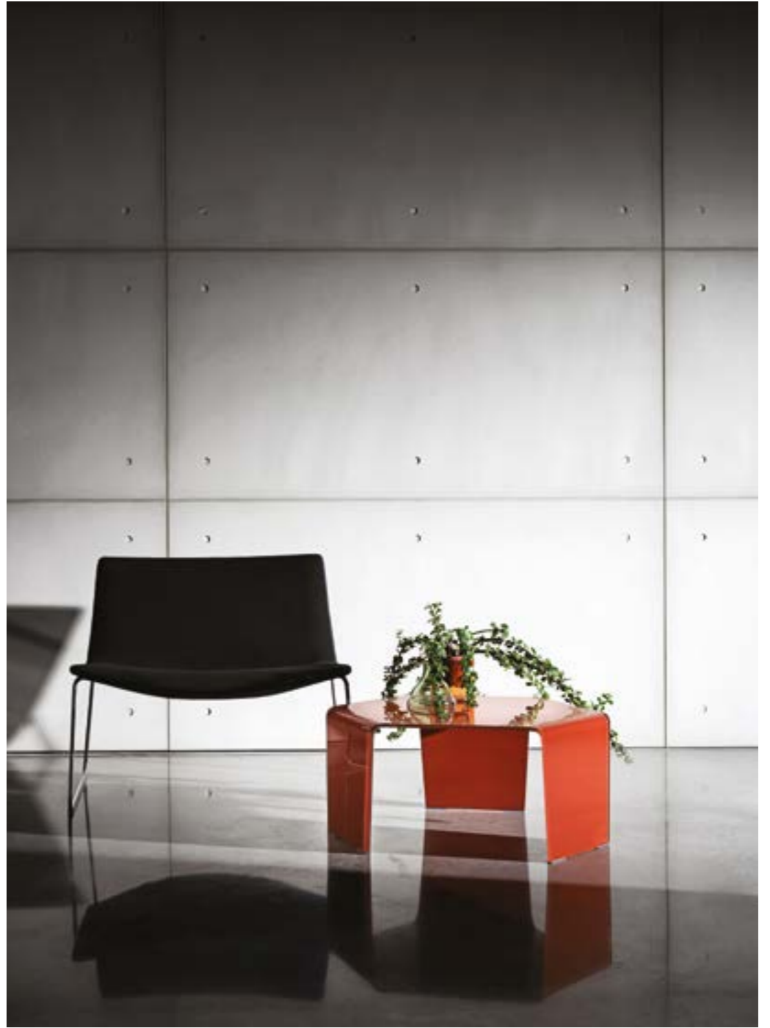
3 Feet TER4.