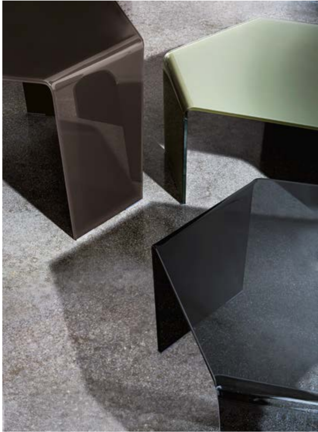
3 Feet coffee tables detail TEC1 / TEV2 / TTF.